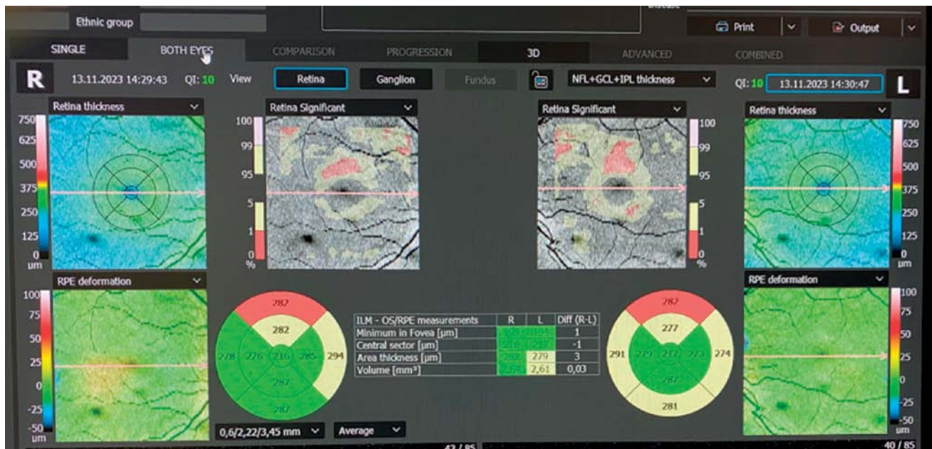
Рис. 1. Ретинальные карты правого и левого глаз до лечения Fig. 1. Retinal maps of the right and left eyes before treatment

Примечание. Фото по результатам ОКТ, проведенного на приеме.