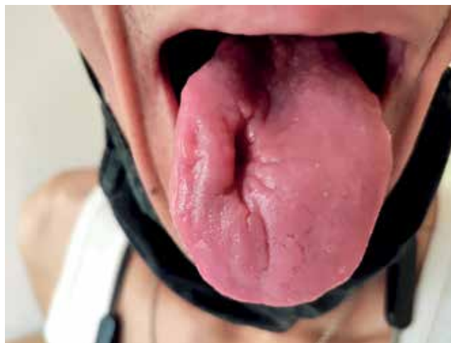
Рис. 1. Пациент М. Туберкулёзная язва языка при поступлении в стационар

При поступлении общее состояние относительно удовлетворительное, индекс массы тела – 18,23 кг/м 2 , температура – 36,8°С. Кожные покровы и видимые слизистые бледные. Язык чистый, на спинке визуализируется трещенообразная язва размером 4,0 × 2,0 см с неровными краями, без налета (рис. 1). Пальпируются переднешейные и