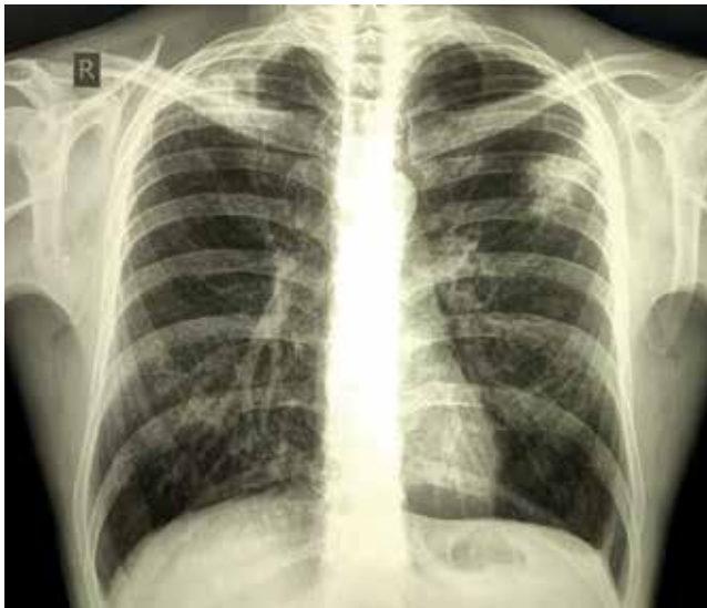
Рис. 2. Пациент М. Рентгенограмма органов грудной клетки при поступлении в стационар Fig. 2. Chest X-ray on admission

центральной врачебной консультативной комиссией (ЦВКК) выставлен клинический диагноз «ВИЧ-инфекция, стадия вторичных заболеваний 4В, фаза прогрессирования без антиретровирусной терапии (АРТ). Диссеминированный туберкулез легких, МБТ(+), ЛУ (R), туберкулез периферических лимфатических узлов. Железодефицитная анемия легкой степени тяжести».