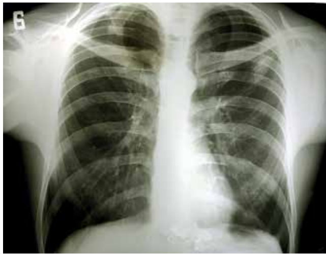
Рис. 4. Пациент М. Рентгенограмма органов грудной клетки в динамике на фоне противотуберкулезной и АРТ терапии Fig. 4. Patient M. Changes on chest X-ray

положению о туберкулезной этиологии язвенного поражения. При рентгенологическом обследовании ОГК выявлен классический синдром диссеминации, диагноз туберкулеза легких подтвержден микробиологически. Скорее всего, развитие ТЯ произошло вследствие инокуляции МТБ с мокротой в слизистую оболочку языка. Несмотря на отсутствие лабораторной идентификации МБТ в язвенном поражении языка, в пользу туберкулезной этиологии свидетельствовала характерная гистологическая картина биоптата. Так как в мокроте молекулярно-генетическим методом были выявлены МБТ, устойчивые к рифампицину, сразу начато лечение туберкулеза по IV режиму, затем, после выявления лекарственной устойчивости еще и к изониазиду, схема была скорректирована. Согласно данному и другим наблюдениям, ТЯ достаточно хорошо поддается этиотропному лечению и имеет благоприятный исход [3, 12].