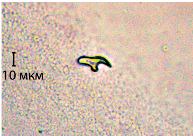
Рис. 2. Крючок протосколекса эхинококка. \times 400 .