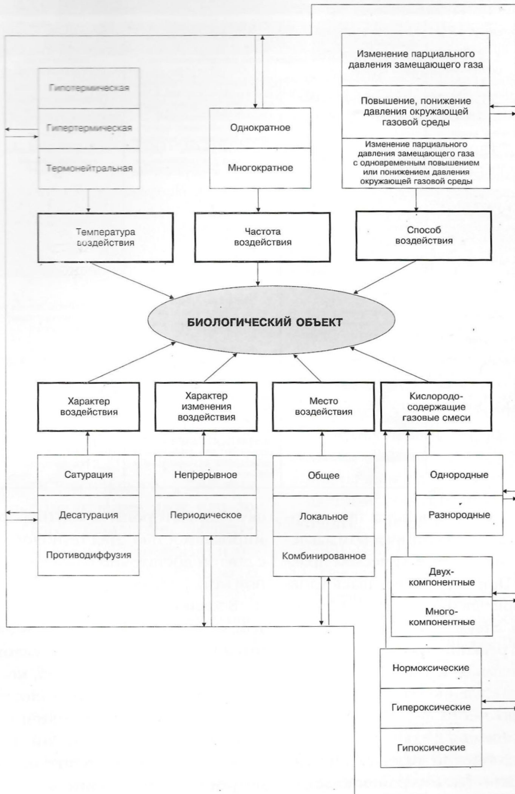
Схема вариантов газового молекулярно-клеточного «массажа»