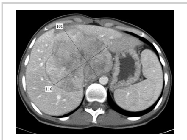
Рис. 1. КТ-картина до химиоэмболизации.

Fig. 1. CT image before chemoembolization.