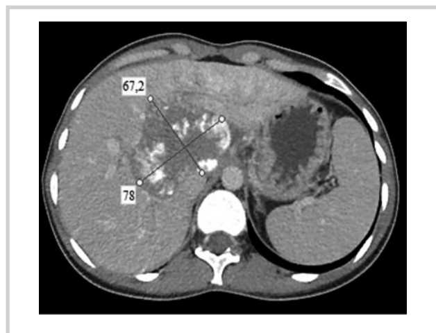
Рис. 2. КТ-картина после 4 курсов химиоэмболизации.

Fig. 1. CT image before chemoembolization.