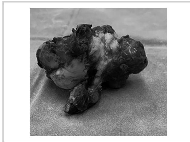
Рис. 5. Удаленный препарат.

Т. Тухун и соавт. [7] приводят результаты 191 ауто-трансплантации печени, выполненной по поводу первичного и метастатического рака печени. В 101 наблюдении операция произведена по методике ex vivo и в 90 случаях — ant-esitum . Частота послеоперационных осложнений состави-