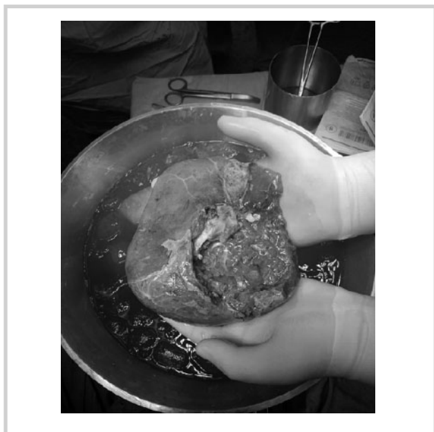
Рис. 4. Резекция печени «back-table».