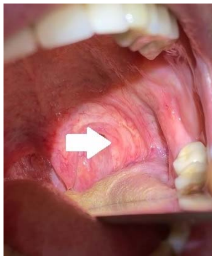
Рис. 2. Картина при мезофарингоскопии. Стрелкой обозначено вбухание задней стенки глотки слева Fig. 2. Picture on mesopharyngoscopy. The arrow indicates swelling of the posterior pharyngeal wall on the left side

При УЗИ мягких тканей шеи: УЗ признаки гиперплазии (12×6 мм) подчелюстного лимфатического узла слева.