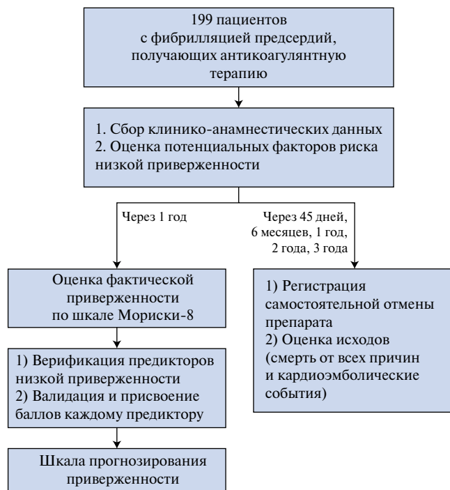
Рис. 1. Дизайн исследования.

Статистический анализ. Статистический анализ проводился стандартными методами с применением статистической программы IBM SPSS Statistics, версия 26. Проверка на нормальность распределения количественных показателей проводилась методом Колмогорова-Смирнова с поправкой Лиллиефорса